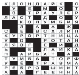
Ответы на сканворд в «ЖБ» № 21

Уважаемые читатели! Первые три человека, правильно и полностью разгадавшие сканворд, будут вознаграждены билетами в кинотеатр «Динамит». Разгаданные сканворды приносите в редакцию.